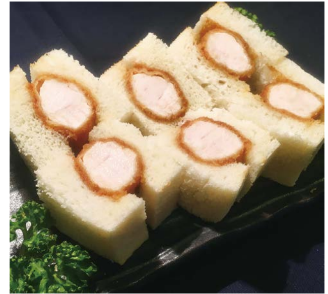
⑨ 名物ささみカツサンド Chicken Tenderloin Cutlet Sandwich 1,450 円 (税込)