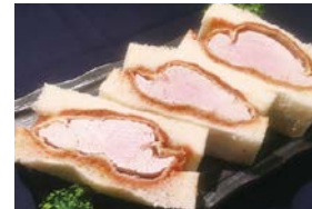
⑩ 特選ヒレカツサンド Special Pork Tenderloin Cutlet Sandwich 2,300 円 (税込)