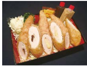
③ ささみカツ三昧弁当 (梅紫蘇・チーズ・ブレン) Three Flavors Of Chicken Tenderloin Cutlet Bento 1,700 円 (税込)