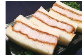
⑪ ロースカツサンド Pork Loin Cutlet Sandwich 1,700 円 (税込)