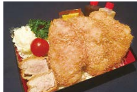
⑥ 一口ヒレカツ弁当 Pork Fillet Cutlet In One Bite Bento 1,700 円 (税込)