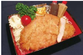
④ ロースカツ弁当 Pork Loin Cutlet Bento 1,700 円 (税込)