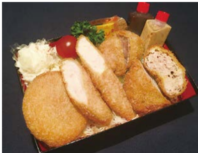
⑧ イマカツ弁当 (ささみカツ・一口ヒレカツ ・メンチカツ・カニクリームコロッケ) Imakatsu Bento 1,700 円 (税込)