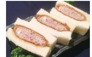
⑫ 手作りメンチカツサンド Menchu-Cutlet Sandwich 1,200 円 (税込)