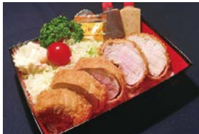
⑤ 特選ヒレカツ弁当 Special Pork Fillet Cutlet Bento 2,300 円 (税込)