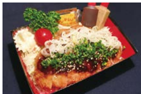
⑦ 味噌カツ弁当 Miso Cutlet Bento 2,000 円 (税込)