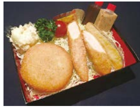
② ささみカツ・カニクリーム弁当 Chicken Tenderloin Cutlet & Crab Cream Croquettes Bento 1,200 円 (税込)

※すべてのお弁当にご飯(白飯)がつきます。 ※ご飯の大盛りは50円増しで承ります。